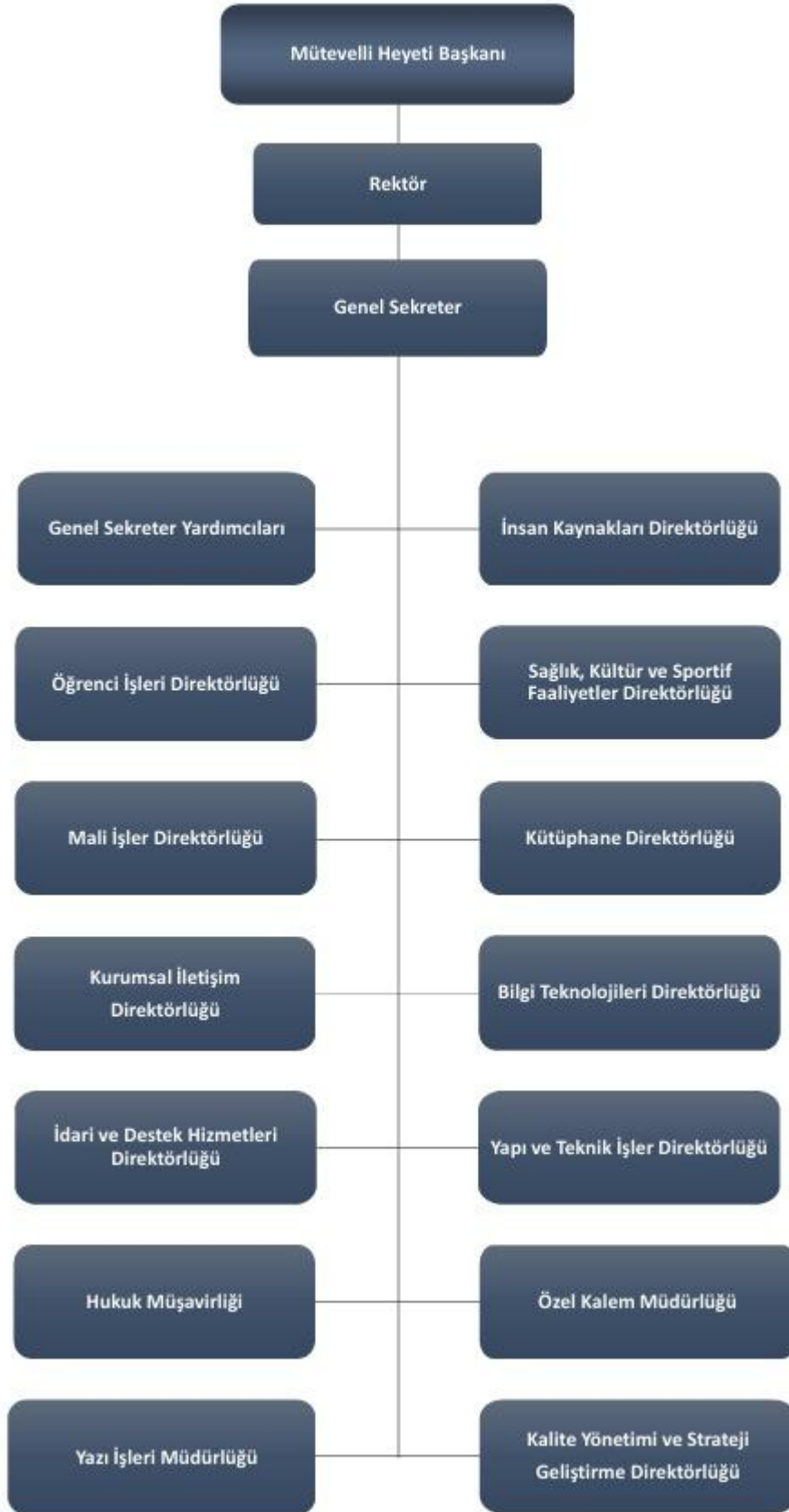
Şekil 2.4.1: İdari Yapı Şeması

2024-2025 yılı İdari Yapı Şeması Şekil 2.4.1’de belirtilen birimlerden oluşmaktadır.